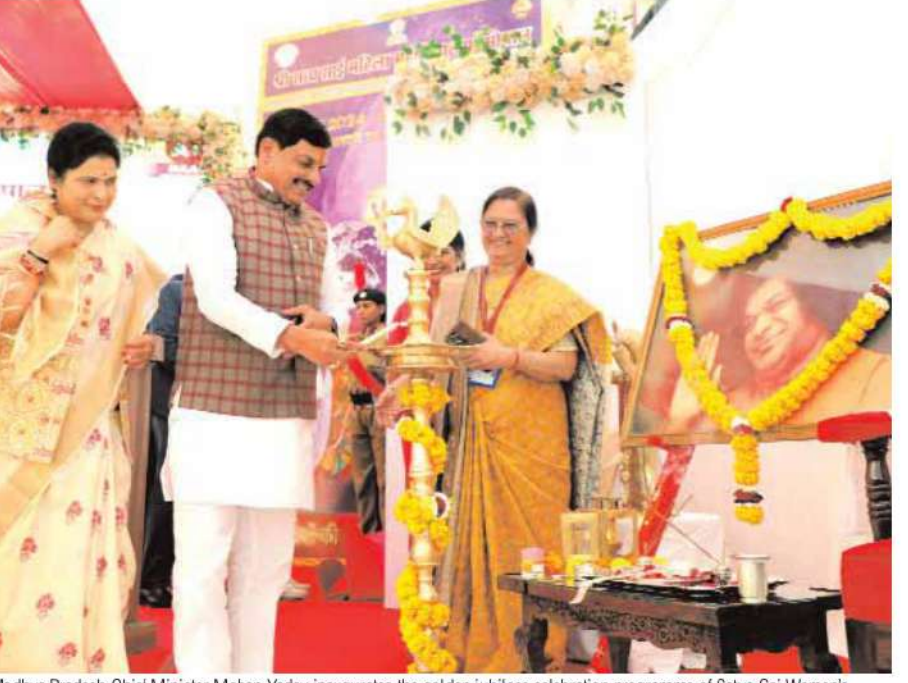
Madhya Pradesh Chiel Minister Mohan Yadav inaugurates the golden jubilees celebration programme of Satya Sai Women's College at BHEL in Bhopal on Friday.

The state government has also introduced a simplified regulatory framework to streamline and expedite the approval process for new projects. This commitment aims to minimize delays and facilitate the establishment and expansion of industrial units in the state.